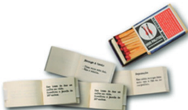
Figura 3 – Microconto Dois Palitos

Além de narrativas eletrônicas, como as dos games , a narrativa digital tem crescido muito dentro do próprio meio digital, ou seja, não se trata de adaptação ou digitalização de obras, mas de criação literária nascida digitalmente. Um exemplo bastante interessante é o do escritor Samir Mesquita, que “escreveu”, por exemplo, Dois Palitos (Figura 3), um livro que reúne cinquenta microcontos com até cinquenta caracteres.