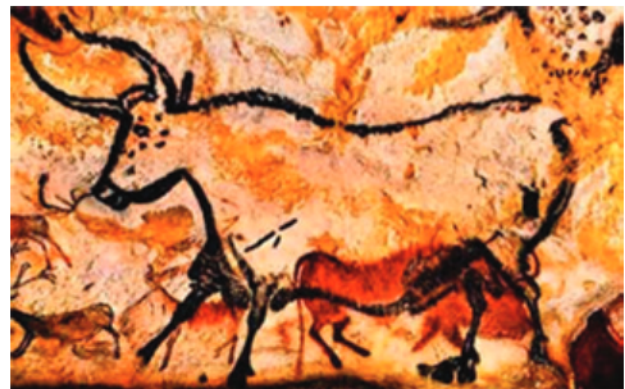
Figura 1 – Animais pintados na Gruta de Lascaux

sangue de animais, pedaços de rochas, ossos, argila, saliva, entre outros materiais. Na América, além dessa arte pré-histórica, existe outro tipo de arte primitiva: a denominada arte pré-colombiana, produzida pelos povos maias, incas e astecas. Esses povos contam a sua história com pinturas, esculturas e templos construídos com pedras. No nosso país, o Brasil, existem locais com pinturas rupestres. Temos essa representação rupestre: no Piauí, em dois parques: o Parque Nacional da Serra da Capivara, em São Raimundo Nonato, e o Parque Nacional Sete Cidades; na Paraíba: Cariris Velhos; no estado de Minas Gerais, em dois sítios: Lagoa Santa e Peruaçu; em Mato Grosso: Rondonópolis. Segue uma imagem (Figura 1) dessa arte rupestre de animais pintados na Gruta de Lascaux, um dos lugares de arte rupestre mais famosos do mundo.